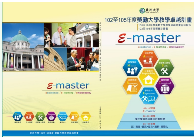
圖說：亞洲大學「e技在身，萬事達人」(E-master)計畫，將早期社會「師傅」精神，導入現代化技能，孕育新世代職場師傅。