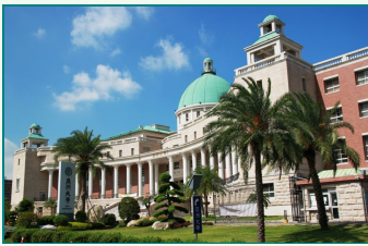
圖說：亞洲大學校園宏偉，校內建築獲國家卓越建設金質獎。

亞洲大學連續第8年獲得教育部評選為教學卓越大學，102至103年各獲得教育部補助4000萬元，累計金額共4億2749萬元。